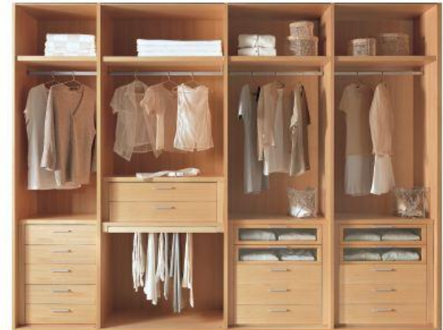
Struttura in tamburato finitura noce tanganika. Honeycomb core structure, with Tangianika waihut finish.