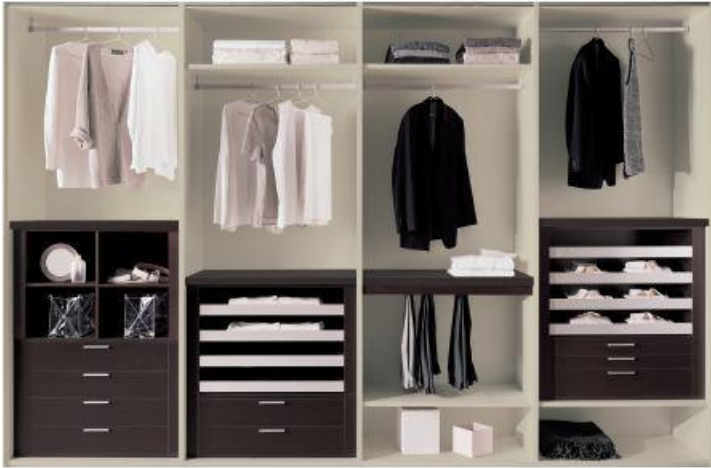
Struttura in tamburato finitura canapa melaminico con parti wengè e alluminio naturale. Honeycomb core structure, hemp-finish melamine with wengè and natural aluminium elements.