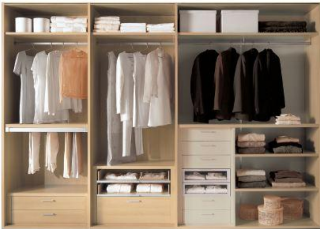
Struttura in tamburato finitura melaminico rovere sbiancato e canapa. Honeycomb core structure, bleached oak and hemp-finish melamine.