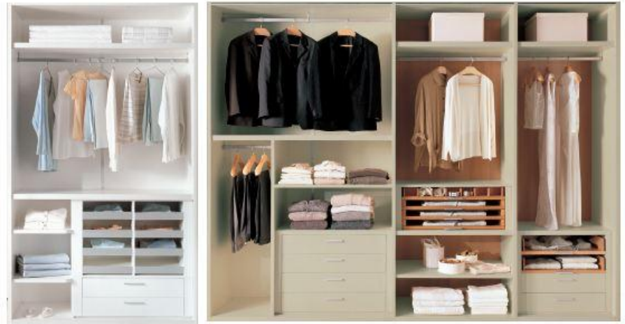
Struttura in tamburato finitura bianco melaminico con bordatura alluminio. Honeycomb core structure, hemp-finish white melamine with aluminium parts.